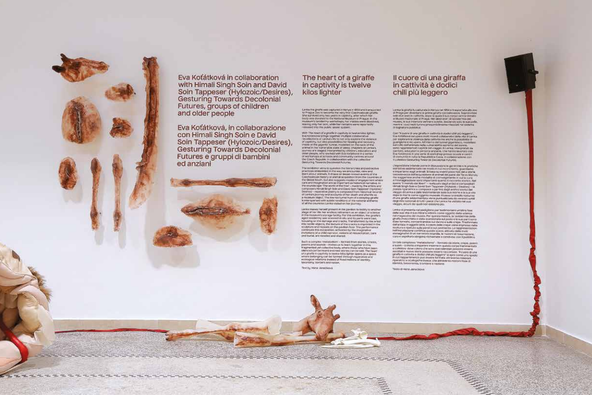
Pohľad do vstupných priestorov Pavilónu Českej a Slovenskej republiky s informáciou o projekte Evy Koťátkovej: Srdce žirafy v zajetí je o dvanásť kilogramů lehčí, 2024.