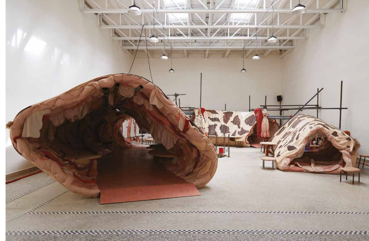
Pohľad do inštalácie Evy Koťátkovej: Srdce žirafy v zajetí je o dvanásť kilogramů lehčí, 2024.