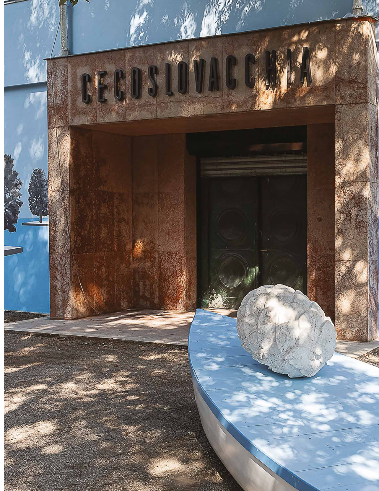
Oto Hudec: Floating Arboretum, 2024. Pavilón Českej a Slovenskej republiky, Giardini, Benátky. Plastika šišky borovice limbovej umiestnená v čline pred vstupom do pavilónu.